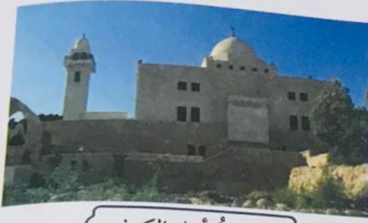
مسجد أهل الكهف

أُنيقُ مقام أهل الكهف في العاصمة عمان في قرية تُدعى (الرّجيب) التي كانت سابقًا تُسمى (الرّقيم)، وقد كُشف عنه عام 1963م، وتُشير الدلائل من موقع الكهف إلى أنه هو المذكور في سورة الكهف، ومن هذه الدلائل القبور السبعة المكتشفة داخل الكهف، والمسجد الذي يعلو المقام، والفجوة الرئيسة والنافذة المطلّة على الفجوة التي كانت تدخل منها أشعة الشمس.